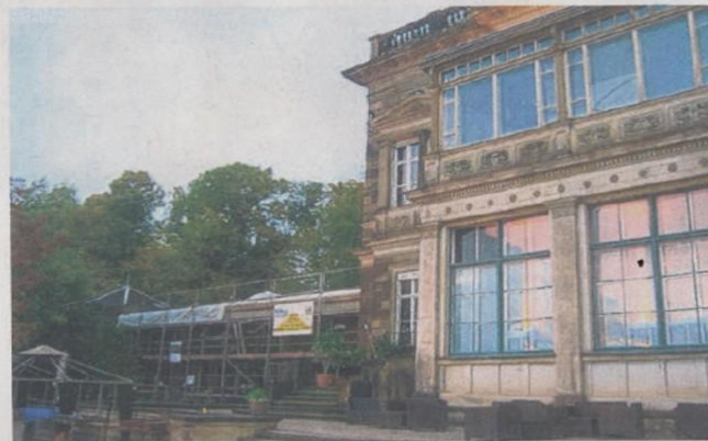
Die nachträglich eingefügten Mauern am Westflügel sind bereits gefallen, die Säulen werden wieder freigestellt.