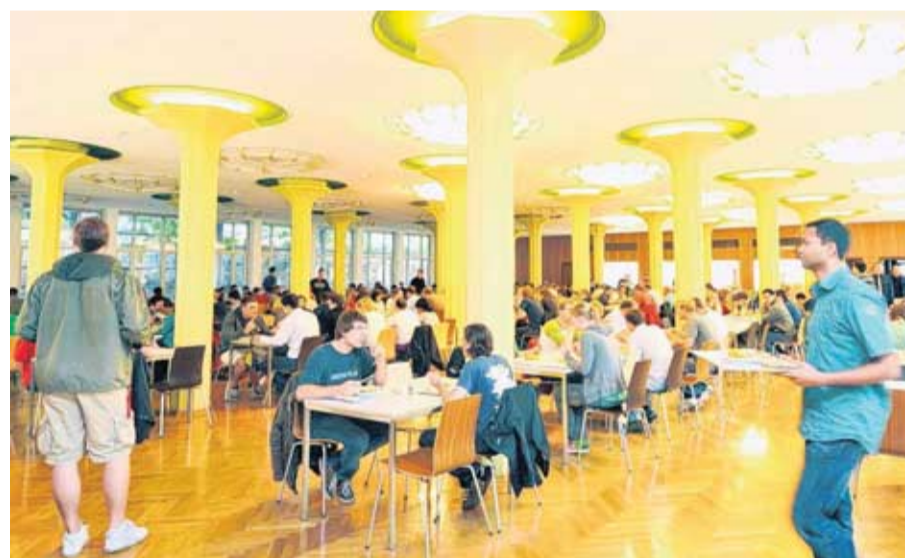
Eigentlich haben die meisten Studenten jetzt frei. Trotzdem zieht es viele in die Alte Mensa der TU Dresden, die sich erneut mit einem „Goldenen Tablett“ schmückt.

Universitätsmagazin Unicum ehrt Alte Mensa mit „Goldenem Tablett“