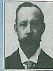
Das Deutsche Hygiene-Museum in Dresden wurde auf Anregung von Karl August Lingner geschaffen.